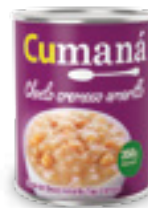
Granos de choclo amarillo tipo cremoso x 350g