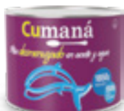
Atún desmenuzado en aceite y agua x 1850g