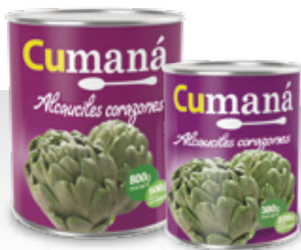
Alcauciles corazones x 800g