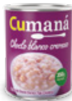
Granos de choclo blanco tipo cremoso x 350g