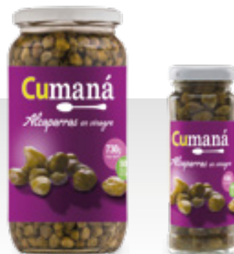
Alcaparras en vinagre x 730g