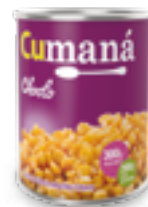
Granos de choclo amarillos enteros x 300g