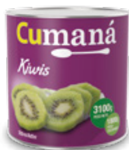
Kiwis en almíbar x 3100g