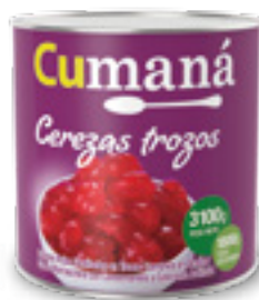
Cerezas rojas confitadas en trozos x 3100g