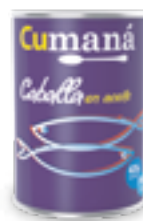
Caballa en aceite x 425g