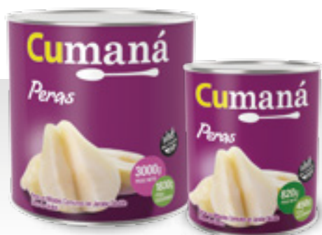
Peras en mitades x 3000g