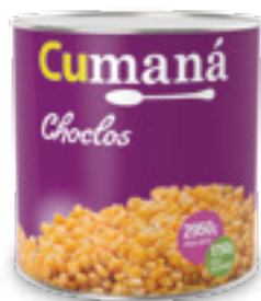
Granos de choclo amarillos enteros x 2950g