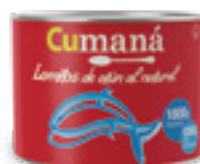
Lomitos de atún al natural x 1800g