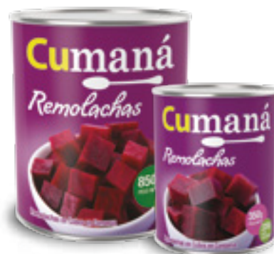
Remolachas en cubos en conserva x 850g