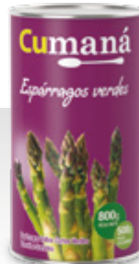
Espárragos verdes x 800g