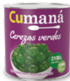
Cerezas enteras verdes descarozadas x 3100g