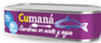
Sardinias en aceite y agua x 125g