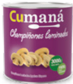
Champiñones laminados x 3000g