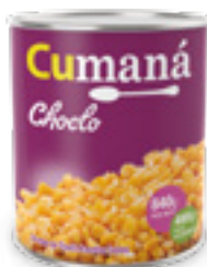
Granos de choclo amarillos enteros x 840g