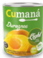
Duraznos en mitades LIGHT x 800g