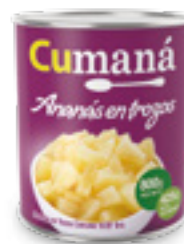
Ananá en trozos x 800g