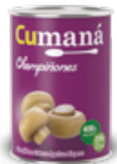
Champiñones enteros x 400g