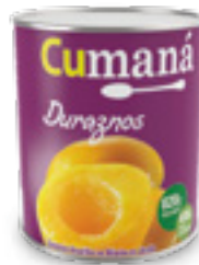
Duraznos en mitades x 820g