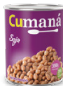
Soja seca remojada x 350g