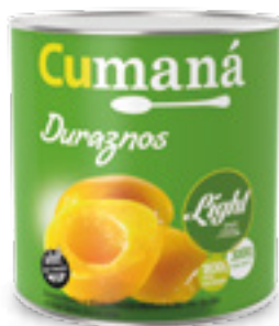
Duraznos en mitades LIGHT x 3000g