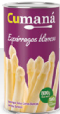
Espárragos blancos x 800g