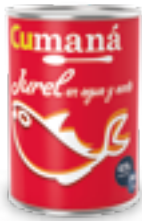
Jurel en aceite y agua x 425g