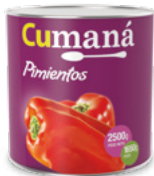
Pimientos enteros x 2500g