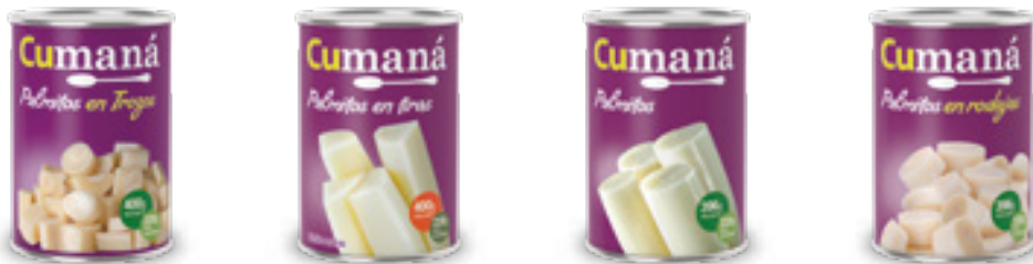
Palmitos en trozos x 400g