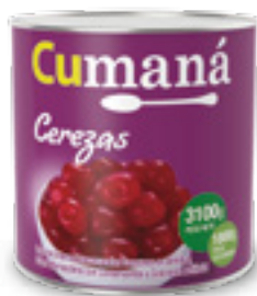
Cerezas enteras descarozadas x 3100g