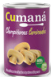
Champiñones laminados x 400g