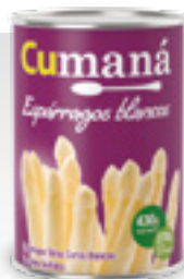
Espárragos blancos x 430g