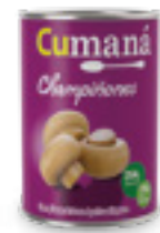
Champiñones enteros x 284g