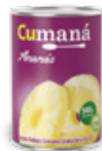
Ananá en rodajas x 565g