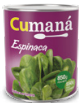
Espinaca en conserva x 850g