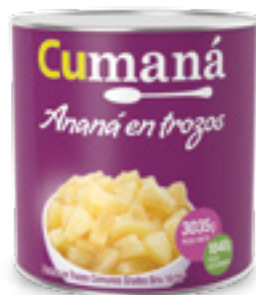
Ananá en trozos x 3035g