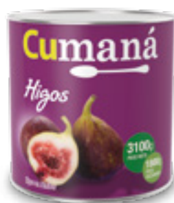
Higos en almíbar x 3100g