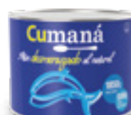
Atún desmenuzado al natural x 1850g