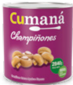
Champiñones enteros x 2840g