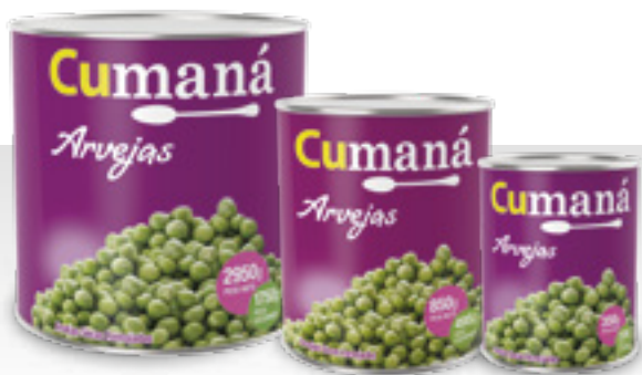
Arvejas x 2950g