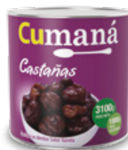
Castañas en almíbar x 3100g