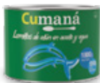
Lomitos de atún en aceite y agua x 1800g