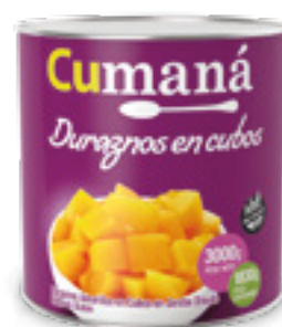
Duraznos en cubos x 3000g