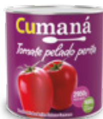
Tomates pelados peritas enteros comunes x 2950g