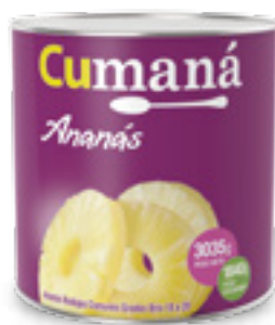
Ananá en rodajas x 3035g