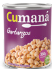
Garbanzos secos remojados x 350g