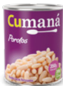
Porotos secos remojados x 350g