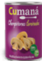
Champiñones laminados x 284g