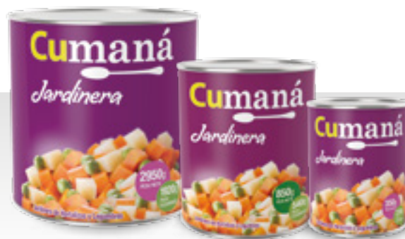
Jardinera x 2950g