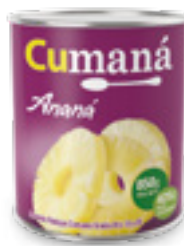
Ananá en rodajas x 850g