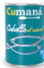
Caballa al natural x 425g