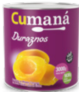
Duraznos en mitades x 3000g