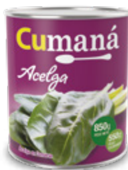
Acelga en conserva x 850g