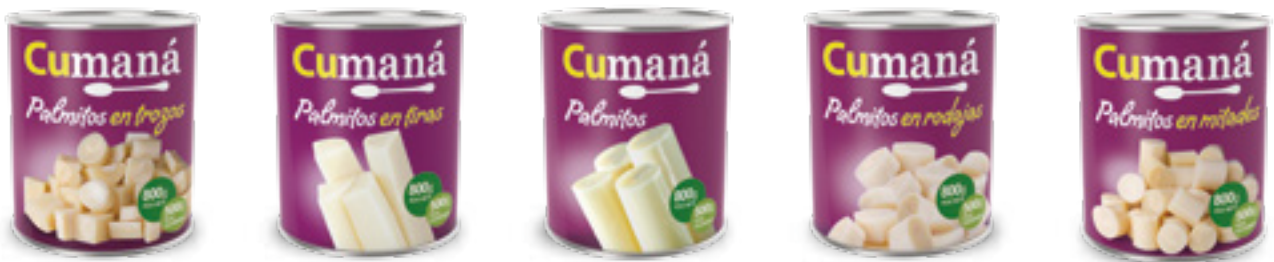
Palmitos en trozos x 800g