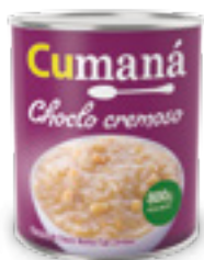
Granos de choclo blanco tipo cremoso x 800g