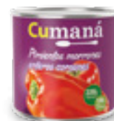
Pimientos enteros x 220g