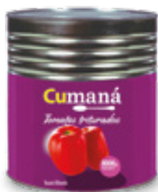
Tomates triturados x 8000g