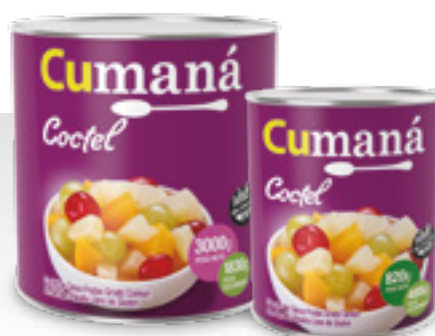
Coctel de frutas x 3000g