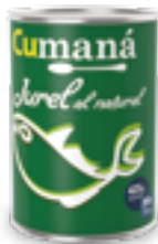
Jurel al natural x 425g