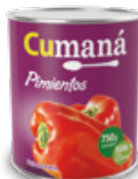
Pimientos enteros x 750g